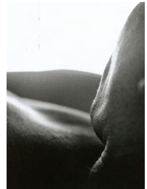
Fig 3. Microdanzas, fotografía, 2003.

Microdanzas es un proyecto de fotografía, vídeo, instalación