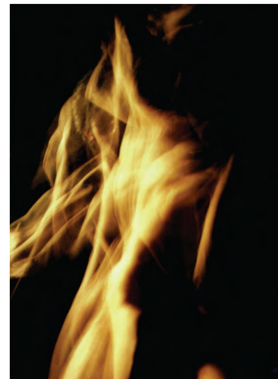
Fig 1. Morfogénesis, performance de danza interactiva, 2003

Disolución del cuerpo múltiple es un proyecto de fotografía, vídeo, instalación, performance y cine generativo que explora dos aspectos interrelacionados: la representación del cuerpo como sedimentación temporal, como estela visual y sonora, y las transformaciones en la propiocepción y el lenguaje que se producen cuando te relaciones en tiempo real con la estela del cuerpo-tiempo que está generando tu movimiento, tu imagen y tu sonido. Las fotografías son imágenes puramente analógicas, sin procesamiento digital alguno, largas exposiciones que capturan la estela del cuerpo en infinitas gradaciones de luz. La cámara, la tecnología de la objetividad por excelencia, se usa para producir un cuerpo inmaterial, fluido, un cuerpo-luz-tiempo en disolución permanente, donde la imagen es la huella, el jeroglífico y la escritura de una coreografía. El proyecto explora la frontera de la abstracción, donde apenas aun se reconocen las formas, expresiones, tiempos e intensidades que permiten reconocer