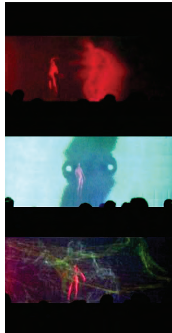
Fig 1. Morfogénesis, performance de danza interactiva, 2003

El principal proyecto de producción de REVERSO es Cuerpos Frontera, que abarca entre otros una performance,